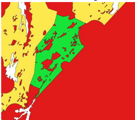
Figur 2. Kartbild över ett grönt område och hur det kan påverkas av andra intressen.