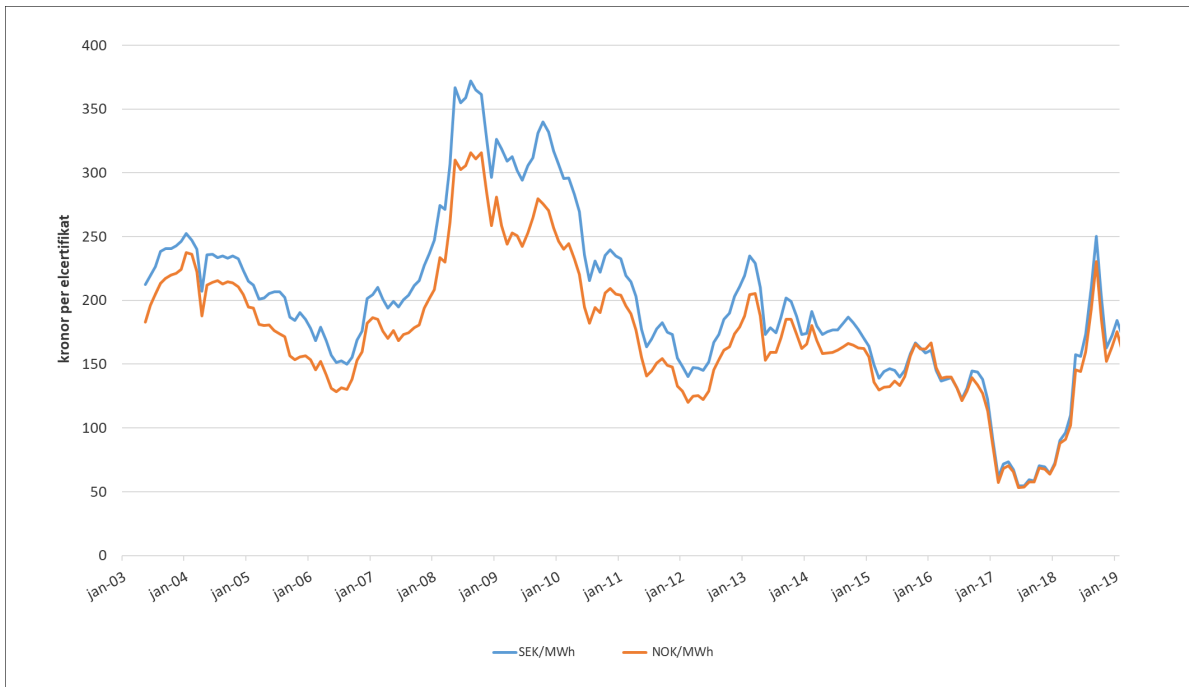
Figur 4. Genomsnittligt (månad) spotkontrakt för elcertifikat handlat hos SKM (uppdaterat t.o.m jan 2019)